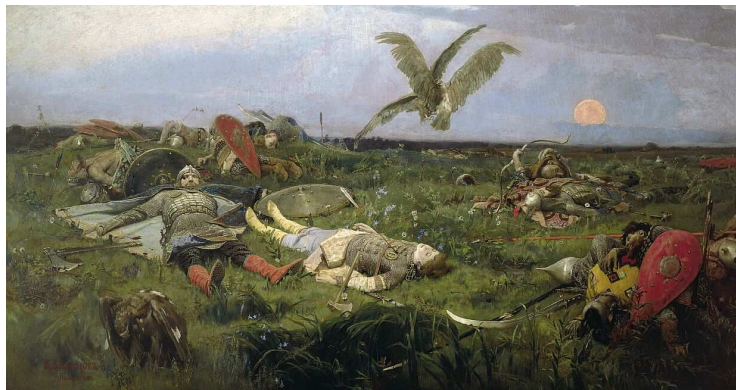
Васнецов. Рать побитая лежит