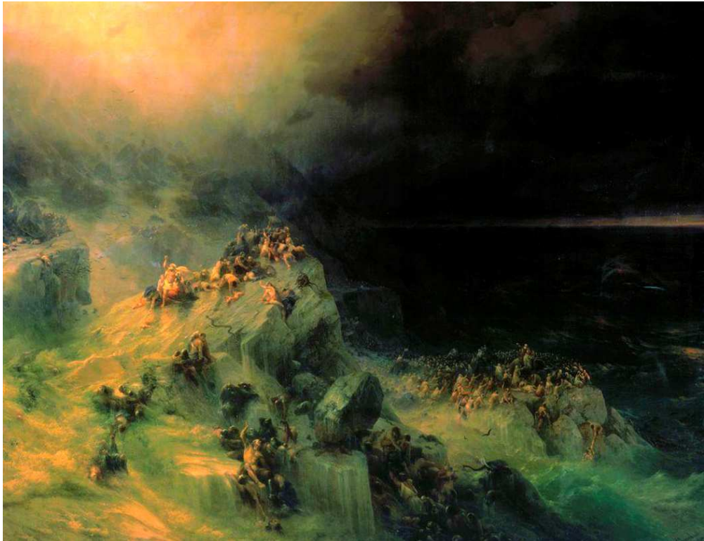
И.К. Айвазовский. Всемирный потоп