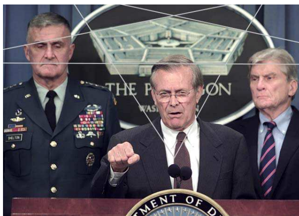
Василиск Змей Горыныч

Когда наблюдаешь европейских политиков, которыми вдруг овладело «бредовое сознание», создается сильное впечатление, что некая власть, подобно Василиску, Змею Горынычу, привела их в ступор своим inferнальным взглядом. Они хорошо сознают, что неповиновение ей – хуже смерти. А велит она одно: Не ставить препятствий на пути мигрантского «цунами»! Это стало для политиков категорическим императивом. Стремясь угодить Василиску, они наперебой восклицают: Наши милые мигранты, наша главная забота – угодить вам! Мы готовы сделать всё, что угодно – лишь бы вам было хорошо у нас! Вы нам дороги, как никто на свете! Вы обогатите нашу культуру! Мы пойдём на любые жертвы! Ваши интересы дороже нам, чем наши собственные! Ради вас мы пожертвуем интересами даже собственных граждан! Мы должны подумать и о том, как вам удовлетворять ваши сексуальные потребности. (По этому вопросу было у «зелёных» даже специальное заседание!)