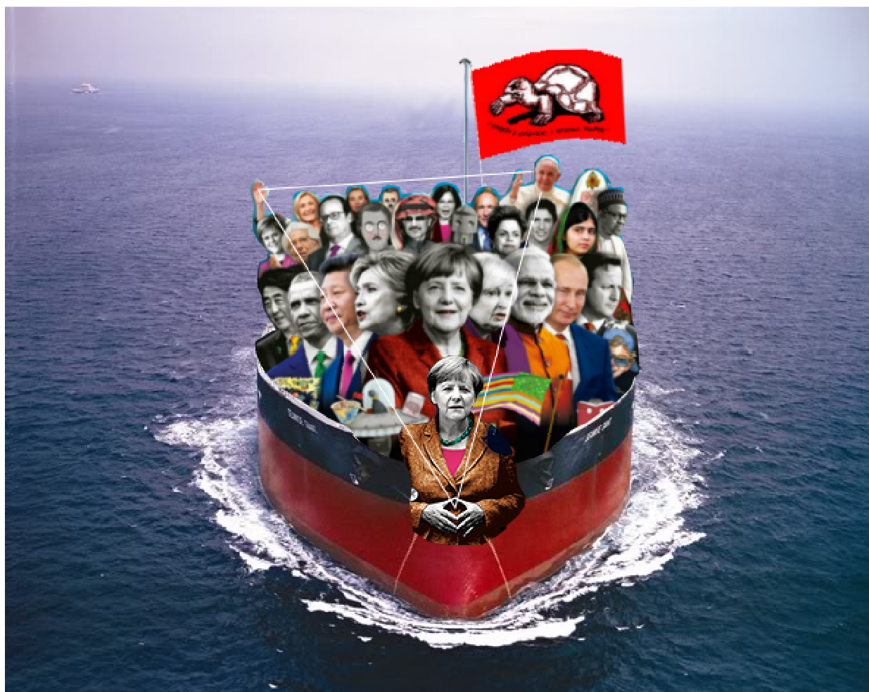
«Всемирный потоп» Гибель континента «Новой Атлантиды». «Нео-Ноев Ковчег»

Пассажиры ведут себя на «Ковчеге» по-разному. Мистер Кэмерон глубоко озабочен. Он решает: А не пора ли с этого «Ковчеха» бежать (валить)? Но как это сделать? Мисс Жанет Эллен, президент ФРС словно бы хочет закричать: Вы что, сдурели? В подобном же настроении пребывает и мадам Лагард. (У женщин всегда больше здравого смысла, чем у мужчин.) Месье Оланд в траурном галстуке. Он – «последний римлянин» – понял неизбежность гибели в общем-то всё равно прекрасной цивилизации и уже смирился с этим. Путин загадочно инвертирует. Он размышляет.... Да, о чём он, собственно, размышляет?